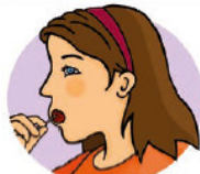
Wange beide Seiten