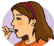
Unter der Zunge