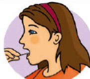
Auf der Zunge