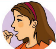
Zahnfleisch unter der Unterlippe