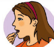
Harter und weicher Gaumen