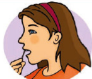
Zahnfleisch unter der Oberlippe

Mundhöhlenabstrich (Speichelprobe): Führen Sie den Abstrich mit dem grösseren der beiden Tupfer durch, indem Sie ihn an folgenden Stellen leicht drehen: